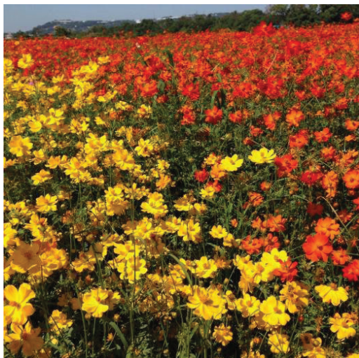
台中新社花海節 Taichung Xinshe Sea of Flowers

To orientate us to life in Taiwan, NSYSU also assigned a Taiwanese buddy to all exchange students and regularly organized cultural trips and events during our stay. Taiwan boasts an abundance of options to fill our time, and never left us bored. here. By the end of exchange, my buddy and I have become such good friends that I have been bugging her to come visit me in Singapore! While the idea of living abroad for a few months might sound a little intimidating at first, the friendliness of the Taiwanese people and familiarity of the Asian culture made life in Taiwan very easy to adapt to. Whether it is food, history, scenery, culture, shopping or entertainment. Getting used to life in Kaohsiung did not take much time, and within a few days of arriving in Kaohsiung, my friends and I were already comfortably settled down and starting to explore this amazing city. In the blink of an eye, 4 months have passed, and it was time to pack up and return back to Singapore.