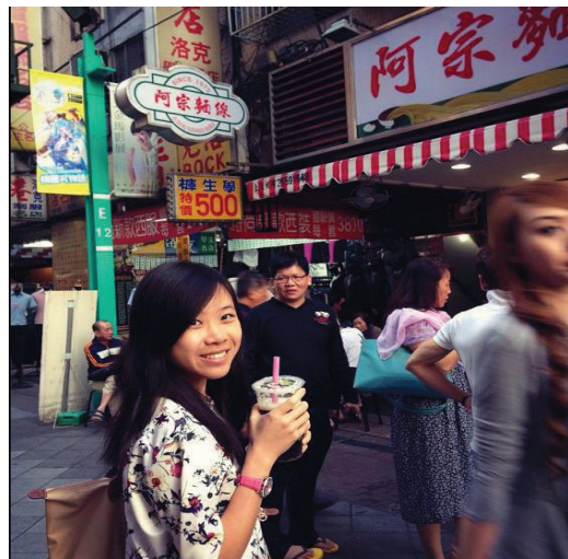
西門町，台北 Ximending, Taipei