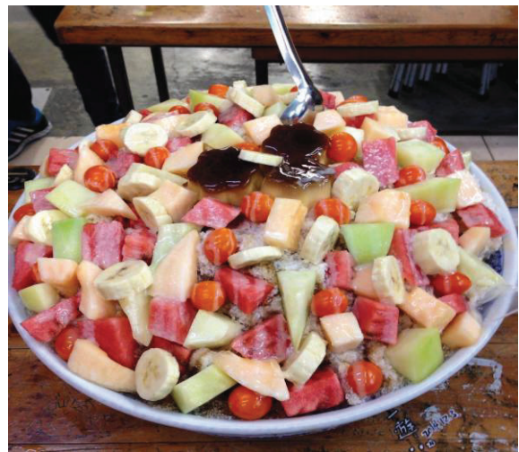
大碗公30倍大挑戰 30x Ice Challenge